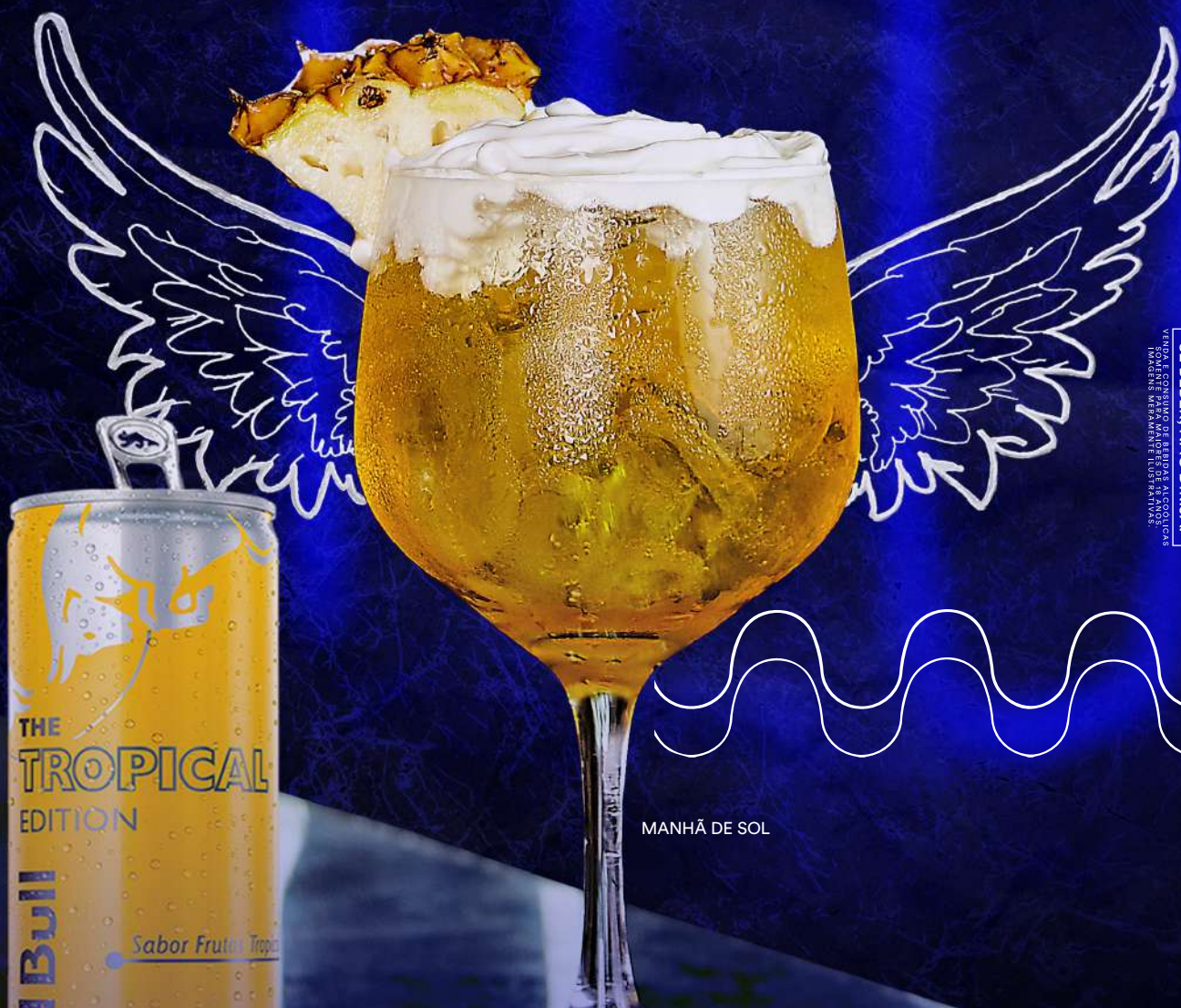
MANHÃ DE SOL

SE BEBER, NÃO DIRIJA. VENHA EXPERIMENTAR AS BEBIDAS ALCOÓLICAS IMAGENS MERAMENTE ILUSTRATIVAS.