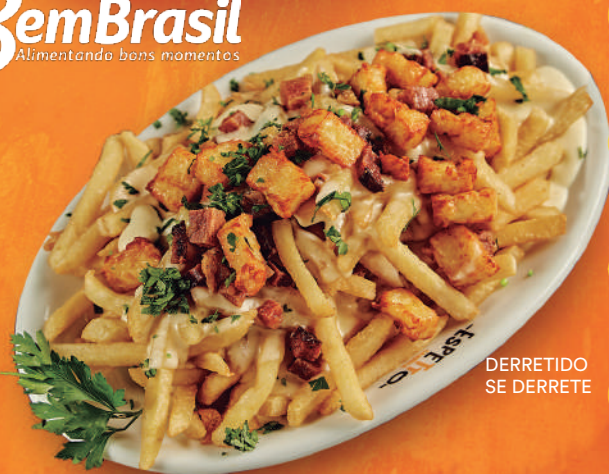
DERRETIDO SE DERRETE