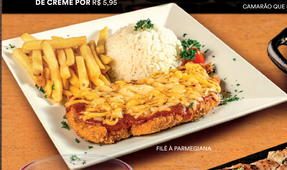
FILÉ À PARMEGIANA

E PARA sobremesa? PEÇA UMA BOLA DE SORVETE DE CREME POR R$ 5,95