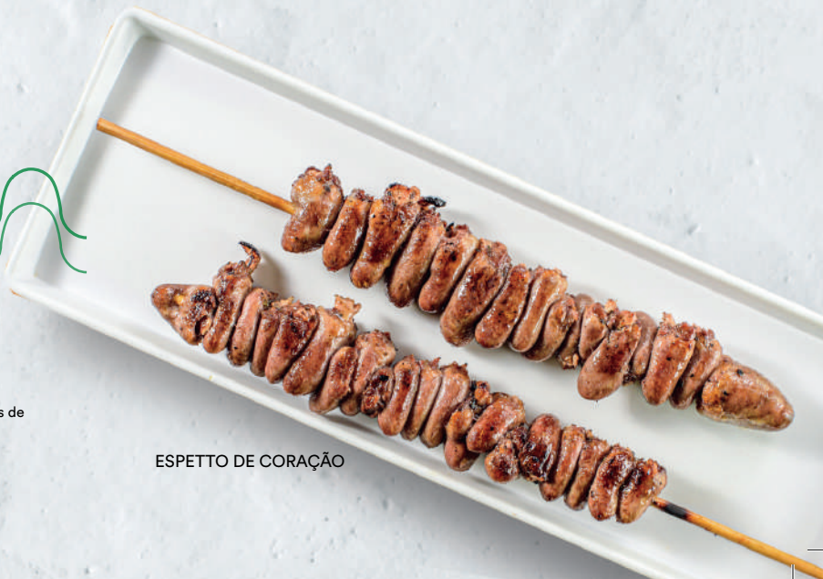
ESPETTO DE CORAÇÃO

ADICIONE 1 ESPETTO TRADICIONAL por + R$ 11,95