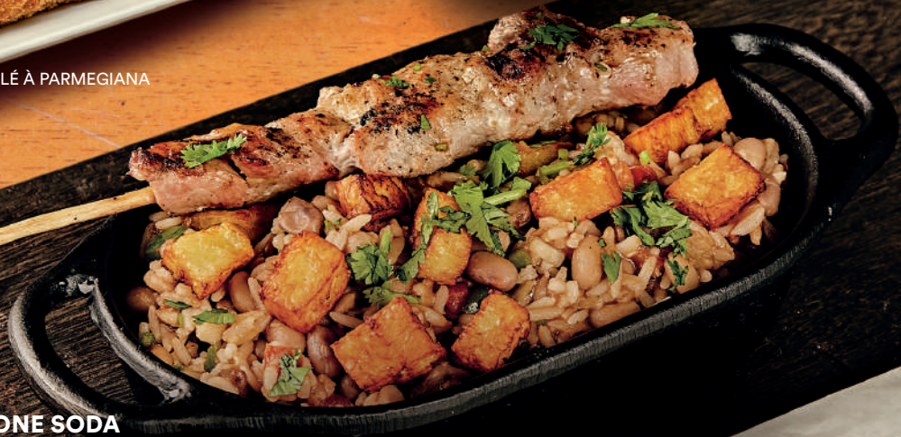
BAIÃO DE DOIS