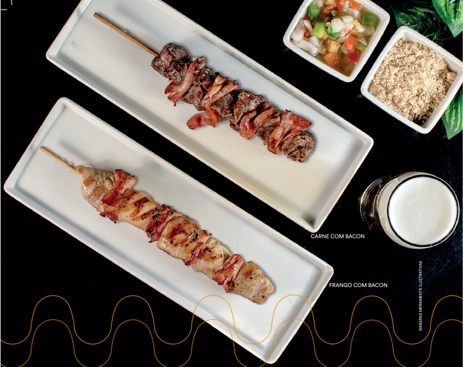
CARNE COM BACON