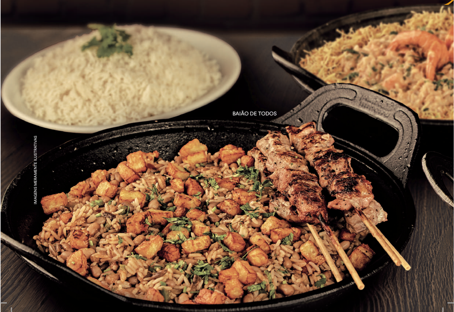
BAIÃO DE TODOS