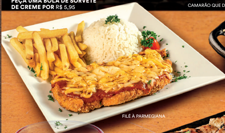
FILÉ À PARMEGIANA

E PARA sobremesa? PEÇA UMA BOLA DE SORVETE DE CREME POR R$ 5,95