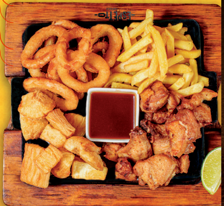
MIX DE PETISCO

DERRETIDO SE DERRETE.....R$ 56,95 Esse prato vai fazer você também se derreter por ele: batata frita, páprica, muçarela, provolone, molho de queijo, creme culinário, bacon frito e queijo coalho.