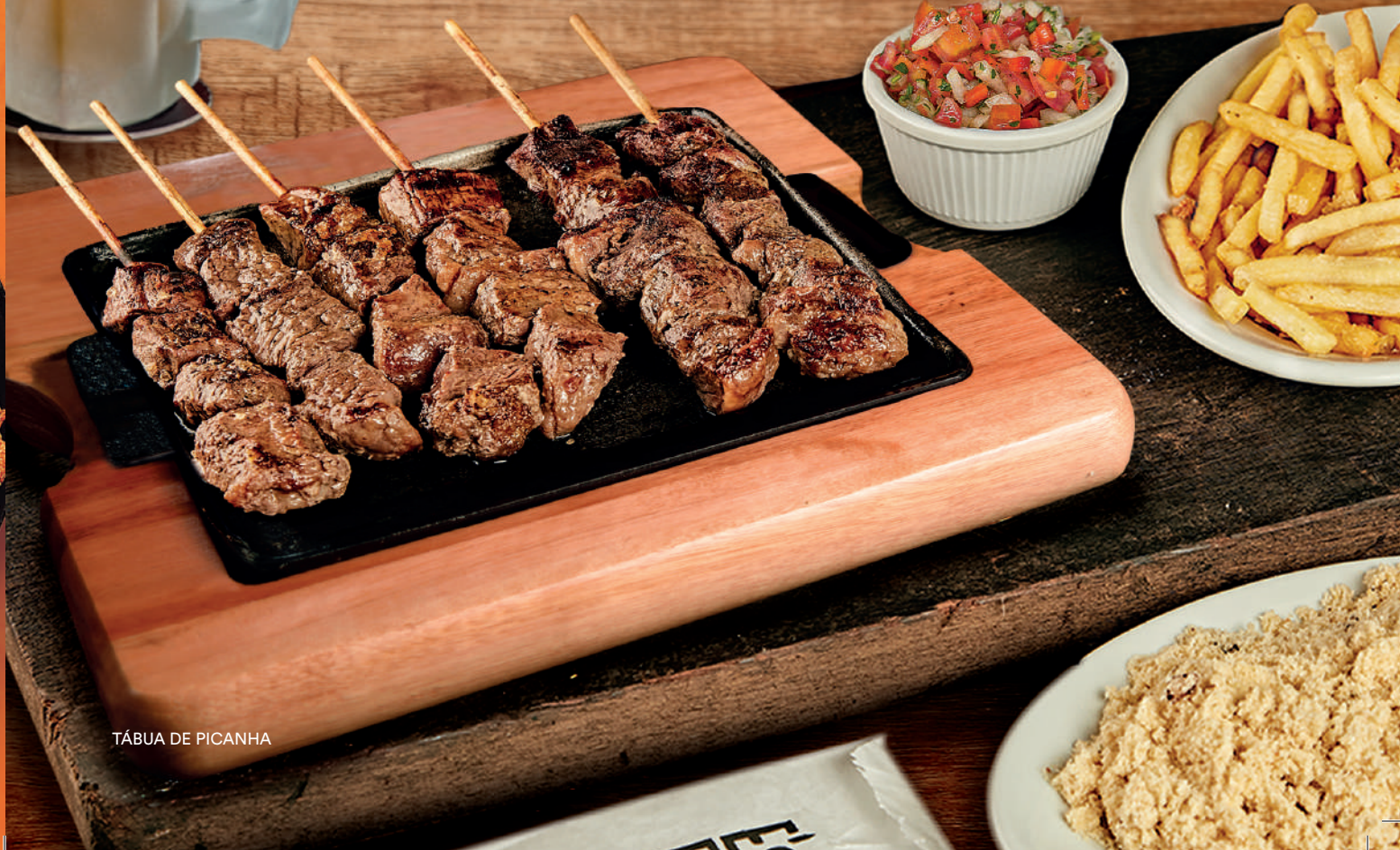
TÁBUA DE PICANHA