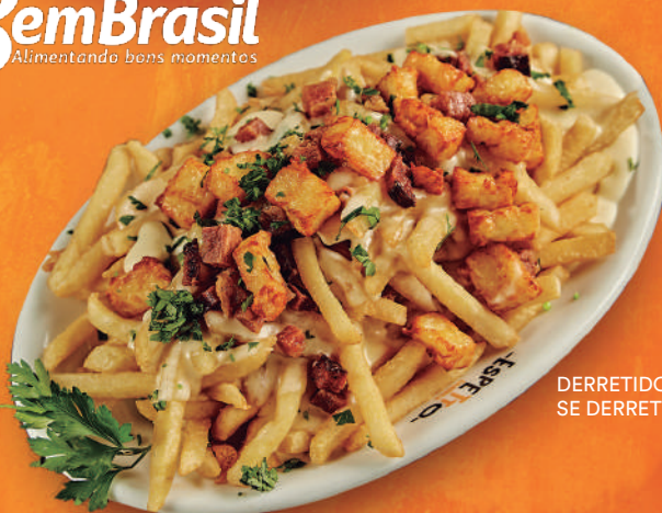
DERRETIDO SE DERRETE