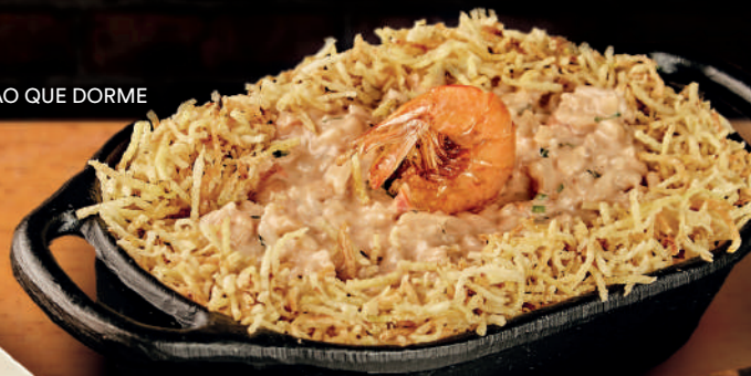
CAMARÃO QUE DORME