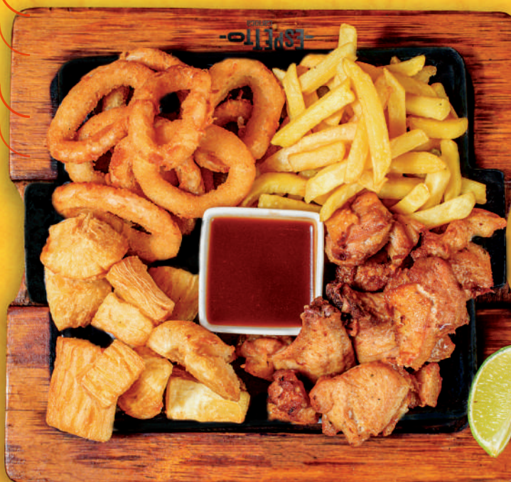
MIX DE PETISCO

Esse prato vai fazer você também se derreter por ele: batata frita, páprica, muçarela, provolone, molho de queijo, creme culinário, bacon frito e queijo coalho.