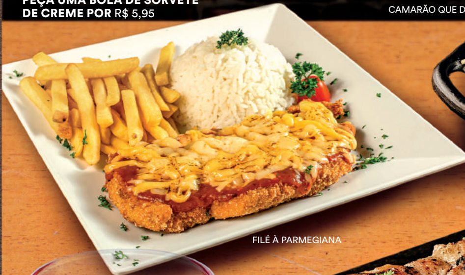
FILÉ À PARMEGIANA

E PARA sobremesa? PEÇA UMA BOLA DE SORVETE DE CREME POR R$ 5,95