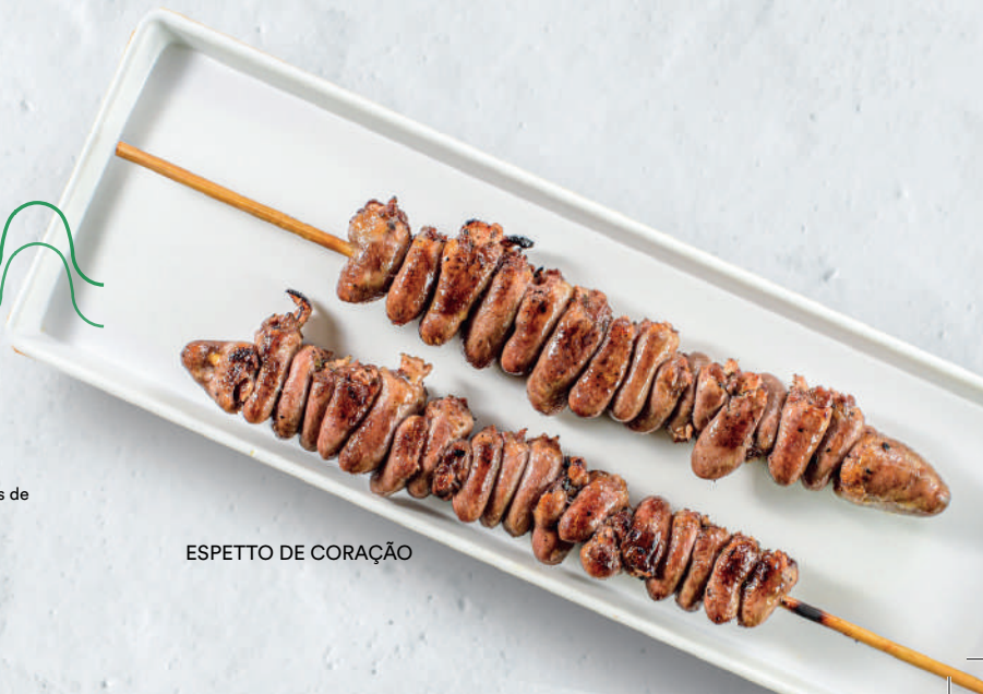
ESPETTO DE CORAÇÃO

ADICIONE 1 ESPETTO TRADICIONAL por + R$ 11,95