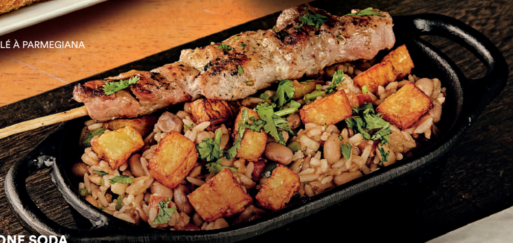
BAIÃO DE DOIS